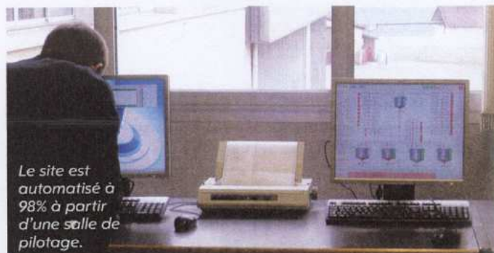
Le site est automatisé à 98% à partir d'une salle de pilotage.