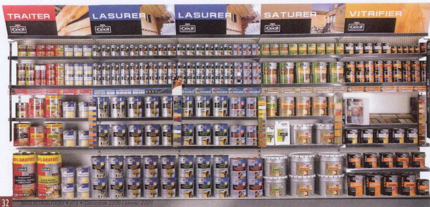
Le linéaire Cecil sera déployé de janvier à l'été prochain.