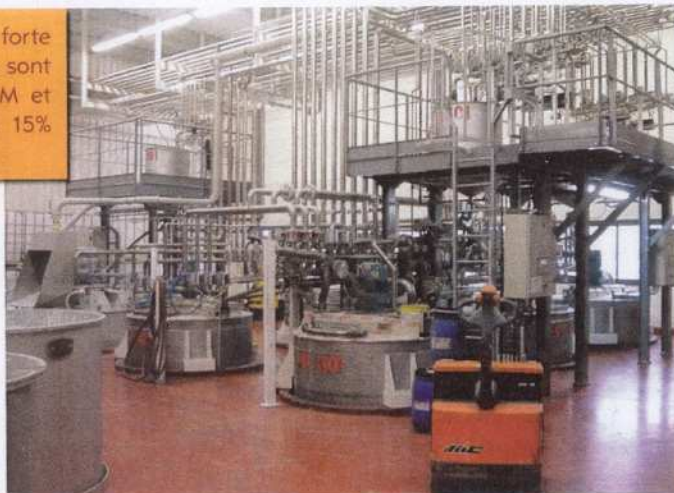
Il y a dix ans, 80% des produits étaient fabriqués à base de solvant pour 20 % en phase aqueuse. Aujourd'hui V33 en est à 50/50 et d'ici deux ans, 80% seront en phase aqueuse.

Toutes ces innovations « produit » sont également portées par une politique de soutien aux distributeurs. Le site internet, ouvert en novembre 2007 pour Cecil Professionnel, propose des pages claires et didactiques (Foire aux questions, renvoi aux distributeurs les plus proches etc.). Le site dispose également d'espaces privés réservés à ses clients, des espaces dédiés ou chaque distribu-